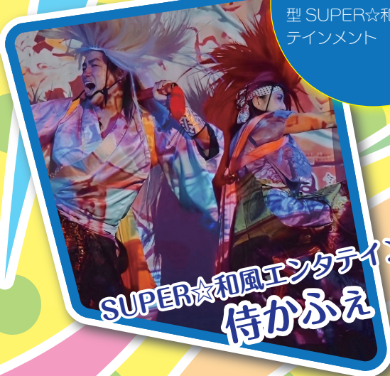
SUPER☆和風エンタテインメント 侍かふえ