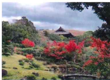
依水園から望む大仏殿と若草山

◎十一月二十七日は晩秋の奈良公園内の名勝庭園「依水園」に行きました。残暑が長かった影響で、例年に比べ遅い紅葉と黄葉が見頃で大変綺麗でした。途中雨が降りましたが、食事中や寧楽美術館の美術品を觀賞中のため傘は不要でした。