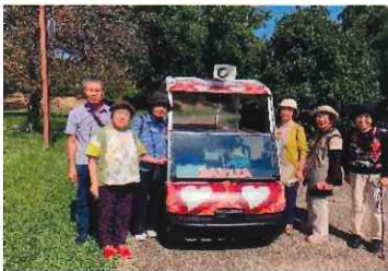
疲れたので電気自動車に乗りました