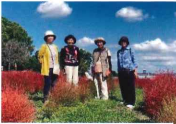
紅葉したカリヨンの丘のコキア

◎十月十日は広い園内を四季折々の花々が彩る馬見丘陵公園へ行きました。夏の酷暑の影響からか、メインのダリアや秋桜の生育が例年に比べて少し遅かったのが残念でしたが、コキアは少し紅葉しかけていました。当日は爽やかな秋晴れの天気に恵まれ、気持ちのよい時間を過ごせました。