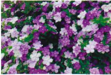
ニオイバンマツリ

◎五月は大山蓮華(オオヤマレンゲ)とニオイバンマツリの花が満開の市内の紀寺にある璉城寺(れんじょうじ)を訪れました。