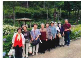
三室戸寺のアジサイ園