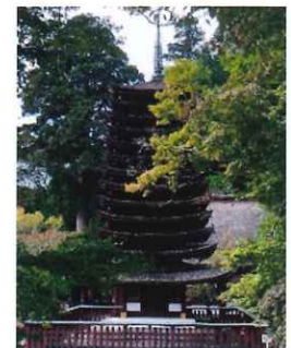
今年の十月三十日の十三重の塔

◎十月三十日は奈良県でも屈指の紅葉の名所の桜井の談山神社に行きました。例年十一月中旬くらいから紅葉のピークですが、大混雑するピークを避けて実施したが、残念ながら猛暑の影響で左の写真のように色づきもしてなく、紅葉には程遠い状況でした。