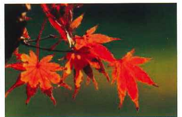
夕陽に映える紅葉

※友人は「あさぎまだら」が大好き、 「あさぎまだら」はふじばかまが好き、 友人はふじばかまをいっばい育てている。