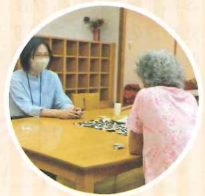
「ここでおしゃべり」