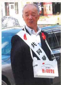
社会福祉法人 奈良県共同募金会 会長