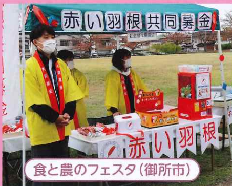
食と農のフェスタ(御所市)