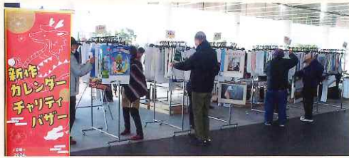
奈良県立図書情報館(奈良市)