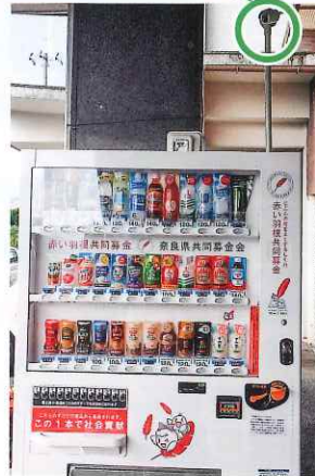
五條市社会福祉協議会