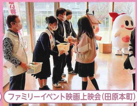
ファミリーイベント映画上映会(田原本町)