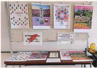
香芝市総合福祉センター(香芝市)