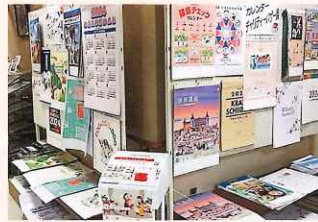
王寺町文化福祉センター(王寺町)

県内外の企業や団体、施設等から、歳末たすけあいとしてカレンダーを寄贈いただき、チャリティー販売しています。