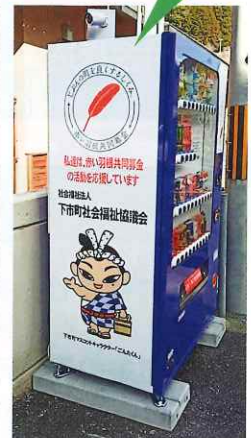
下市町交流センター