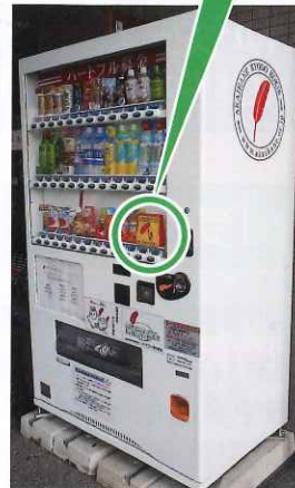
奈良県社会福祉総合センター