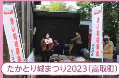
たかとり城まつり2023(高取町)